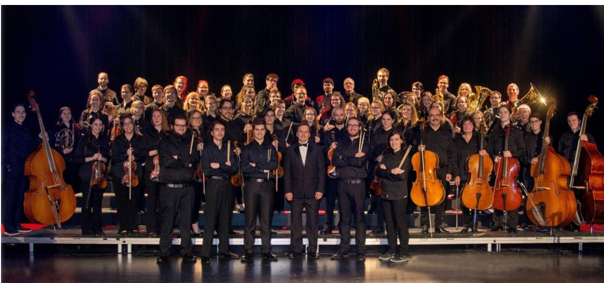
La Symphonie (2016-2017)