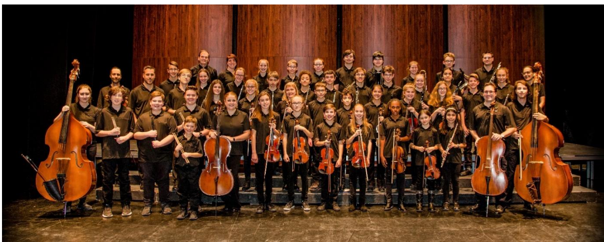
La Relève (2017-2018)